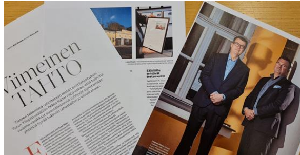
Yliopistosäätiön varainhankinta oli esillä näyttävästi Kauppalehti Optiossa 24.10.2022

Olemme vuoden mittaan tuoneet monin tavoin esille toimintaamme sekä mahdollisuutta testamentata omaisuuttaan tieteelle. Ennen kaikkea olemme tehneet yhteistyötä Turun yliopiston varainhankinnan kanssa omassa roolissamme. Olemme jalkautuneet moniin sidosryhmiin sekä päässeet kertomaan toiminnastamme myös useassa mediassa. Testamenttivarainhankinta on pitkäjänteistä työtä. Uskon vahvasti, että testamentti tieteelle on tulevaisuudessa vaihtoehto entistä useammalle suomalaiselle.